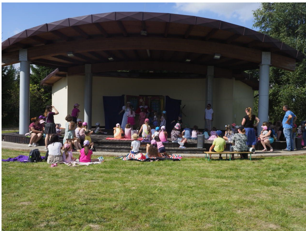
Fot. „Pożegnanie lata z biblioteką”. Amfiteatr w Motyczu