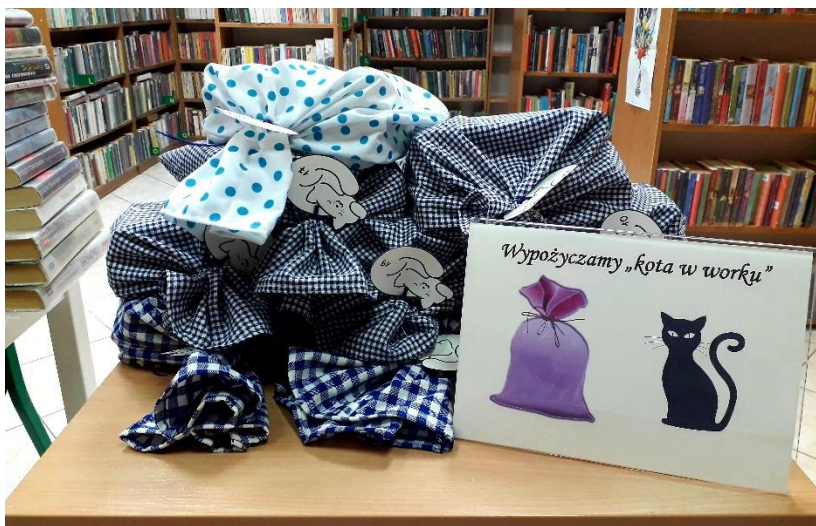
Fot. Akcja promocyjna „Wypożyczamy kota w worku”