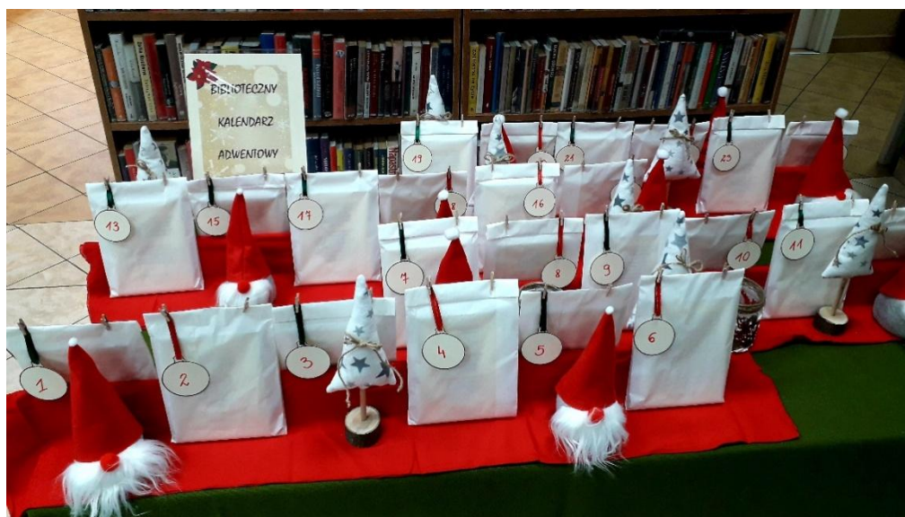
Fot. Grudniowa akcja promująca czytanie poezji „Biblioteczny kalendarz adwentowy”

Zgodnie z wymogami dostępności Biblioteka Publiczna Gminy Konopnica umożliwia osobom niesłyszącym i głuchoniemym skorzystanie z wideo tłumacza podczas kontaktu i korzystania z usług placówki bibliotecznej.