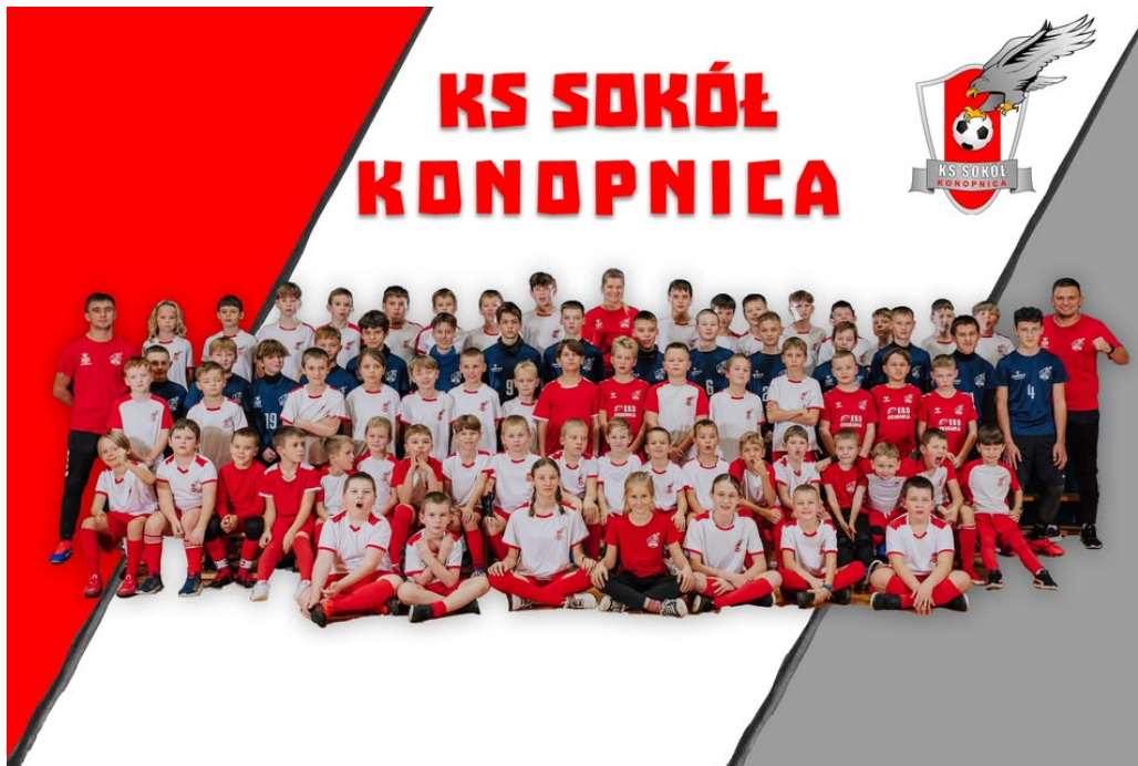
Młodzi zawodnicy trenujący piłkę nożną w LKS Sokół Konopnica