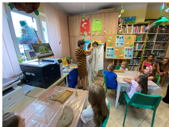
Fot. Zajęcia pt. „Pszczele pożytki”, realizowane w ramach konkursu dla bibliotek „Biblioteki Pełne Dobrej Energii”.