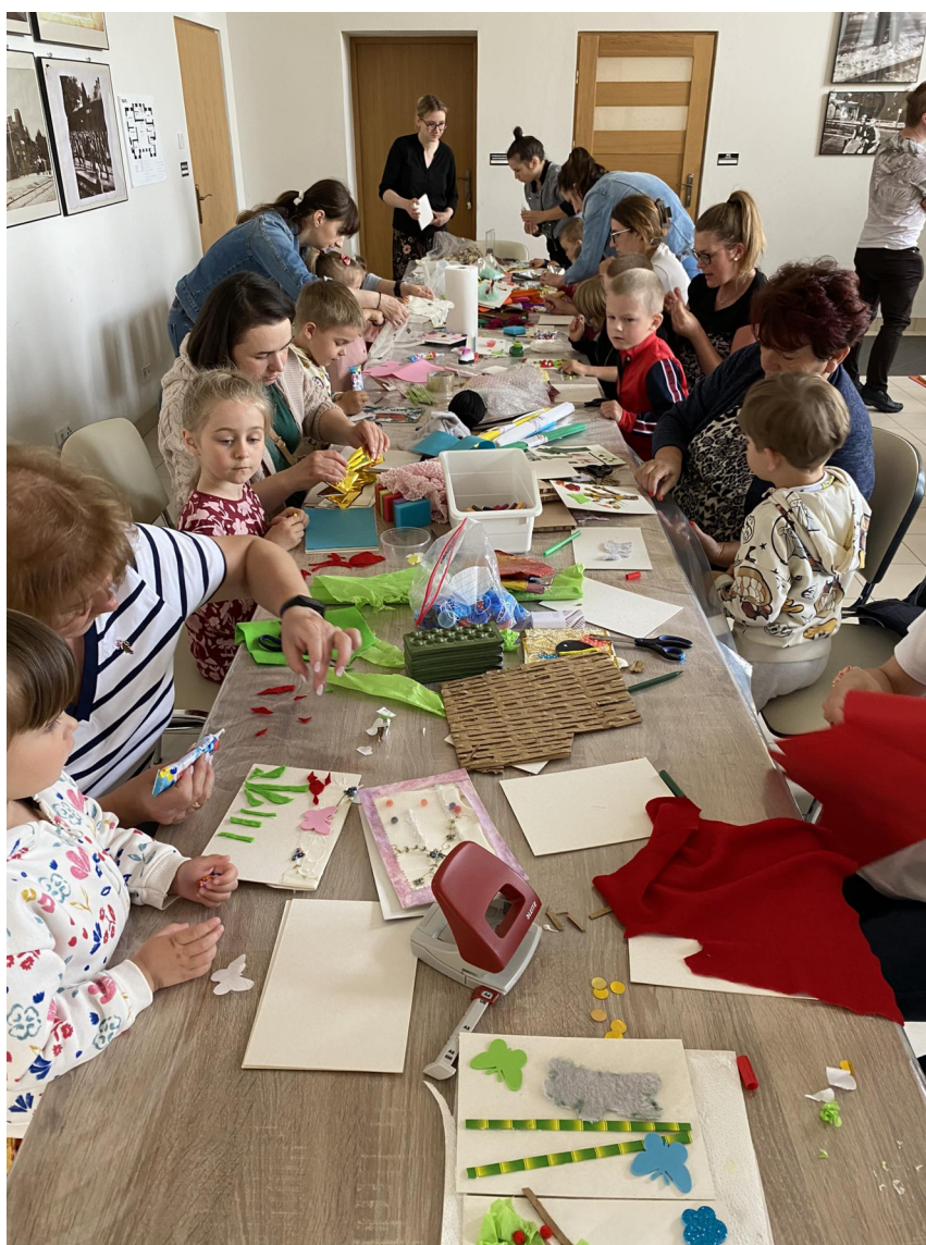
Fot. Warsztaty międzypokoleniowe z tworzenia książki sensorycznej w ramach zadania „Książka dla małych i dużych – promocja czytelnictwa w gminie Konopnica”.