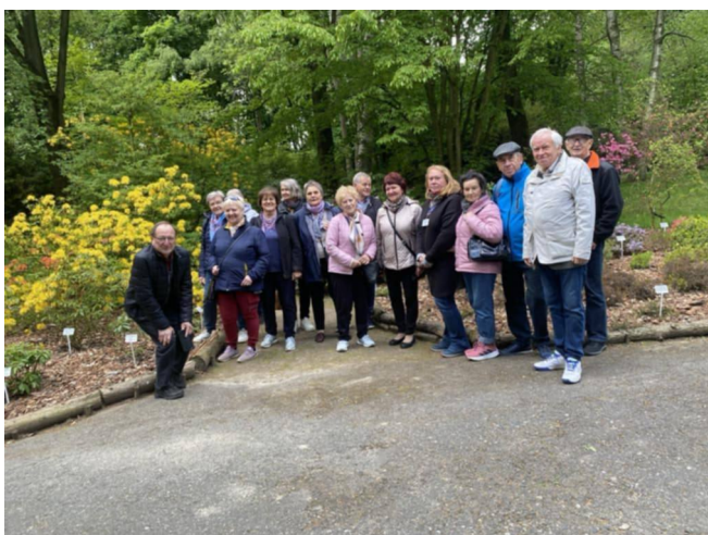
Wyjazd do Ogrodu Botanicznego w Lublinie