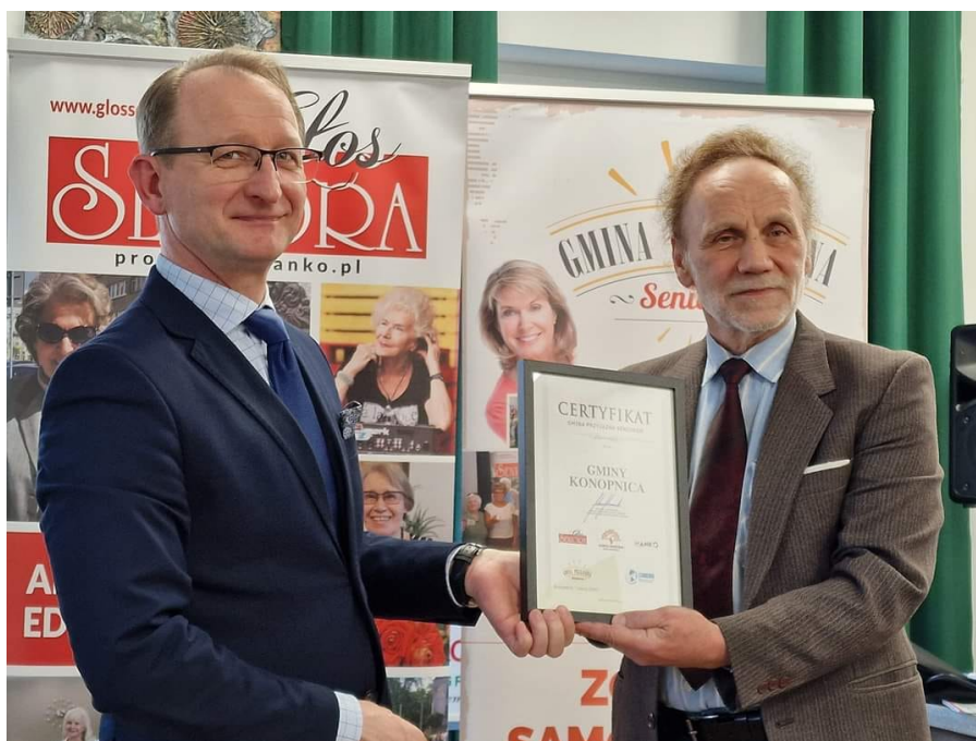
Inauguracja Ogólnopolskiej Karty Seniora w Gminie Konopnica – marzec 2024 r.

Gmina zawarła umowę z koordynatorem działań senioralnych, który ma za zadanie wspierać działające na terenie 3 kluby seniora, aktywizować ich, rozwijać zainteresowania, dostarczać informacji kulturalnej.