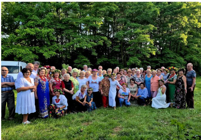
Seniorzy wszystkich klubów podczas Nocy Kupały – czerwiec 2024 r.

Materiały na zajęcia seniorzy mają częściowo finansowane z gminy, wyjazdy na jednodniowe wycieczki zapewnia gmina swoimi busami.