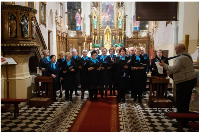
Występ chóru „Niebieskie Chusteczki” podczas uroczystości kościelnej w Zemborzycach.