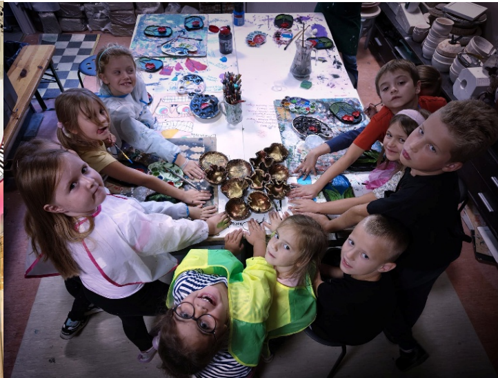
Ogłoszenie Stowarzyszenia Pracownia Twórczych Działalności o warsztatach oraz zajęcia ceramiki dla dzieci