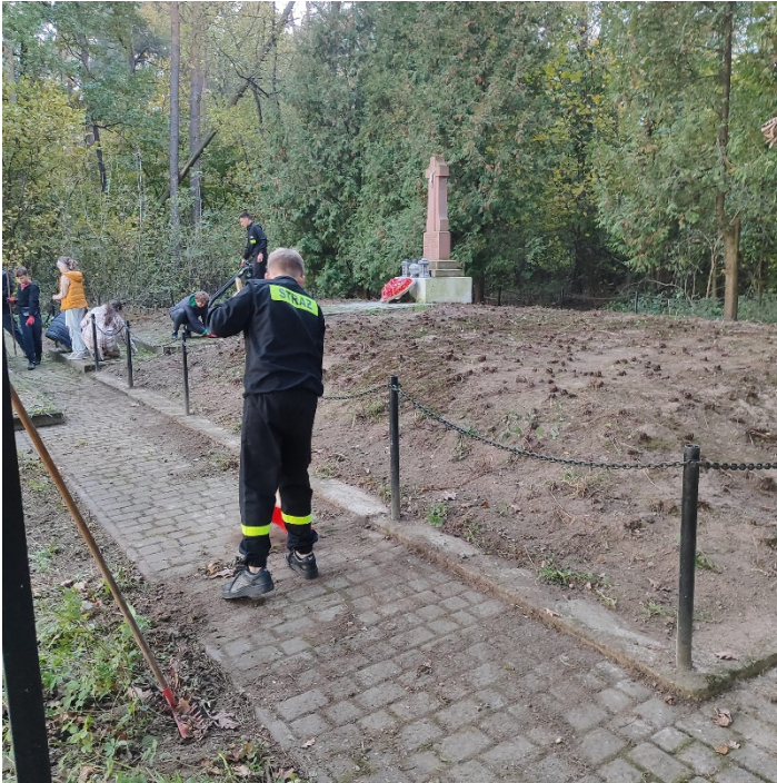
Wiosenne porządkowanie Mogiły Pomordowanych w Radawcu Dużym