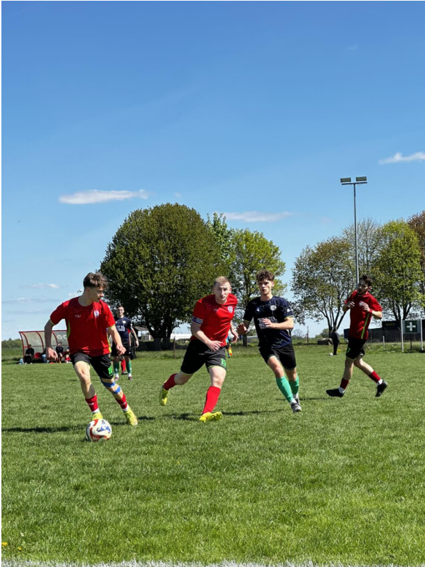
Zawodnicy trenujący w Klubie Sportowym Uniszowice