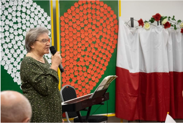
Organizacja Święta Niepodległości w Zemborzycach -listopad 2024 r.